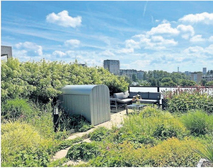
▲ De daktuin biedt uitzicht over de stad.